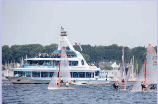
Die MS Hamburg fährt mit Gästen zu den Regattafeldern.