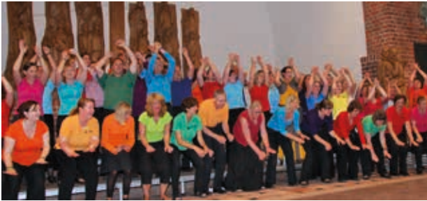
Der Gospelchor Holtenau gibt ein Benefizkonzert zugunsten der Stiftung Drachensee:

Kantorei aus Lebowakgomo, mitgebracht. Alte und neue Lieder erklingen beim Benefizkonzert zugunsten der Stiftung Drachensee am Samstag, 4. Juni ab 19 Uhr in der Michaeliskirche Kiel. Der Eintritt ist frei, es werden Spenden gesammelt, die der Stiftung Drachensee und dem Gospelchor Holtenau zu Gute kommen. Weitere Infos im Netz auf www.gospelchor-holtenau.de .