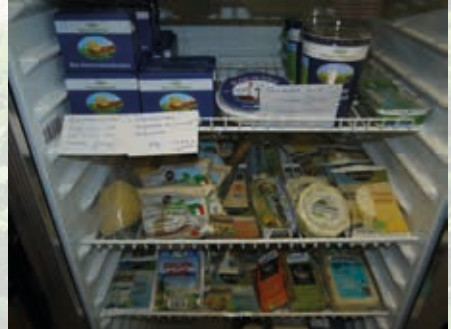
Kurze Wege: Im Hofladen „Gemüse & Meer“ werden Produkte von den eigenen Kühen angeboten

stoffausträgen durchgeführt. Teil des Konzeptes ist der Aufbau einer Herde mit 80 Jersey-Kühen und deren Nachzucht. Ziel ist es, in einem Jahr mit 2 Kühen mehr als 10.000 Liter Milch je Hektar Klee gras zu erzeugen