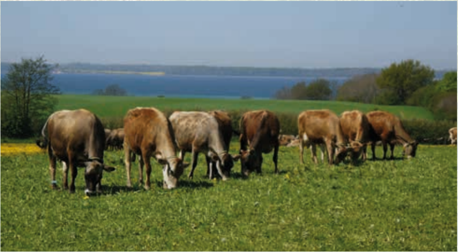
Die robusten Jersey-Kühe sind für die Weidehaltung besonders gut geeignet.