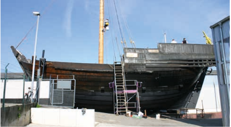
Eichenrumpf und Douglassienmast: Werfzeit für die Hansekogge.