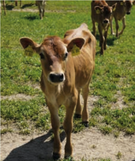
Einige der neu geborenen Jersey-Kälber im Projekt „Ökoeffiziente Weidemilcherzeugung Lindhof“.