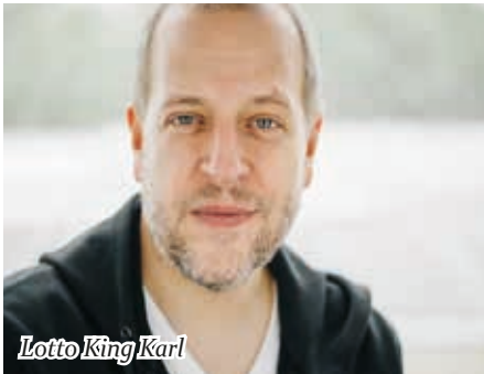
Lotto King Karl

Fußballfan Lotto King Karl im Anschluss an das letzte Gruppenspiel der Nationalmannschaft auftreten und gemeinsam mit den Barmbek Dreamboys das Fußballfest an diesem Abend abrunden. Die genauen Termine sind im Netz zu finden auf www.kiwohoern.de .