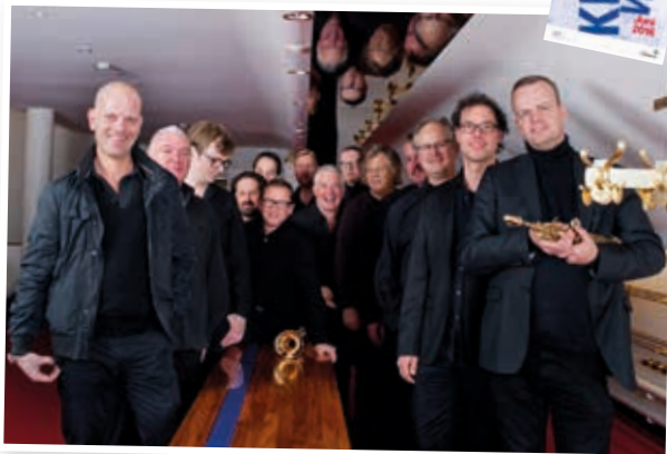
Die NDR Bigband zeigt ihre Bandbreite.