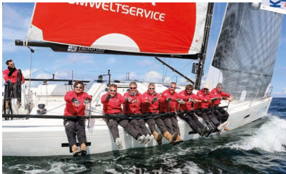
Hart am Wind: Schnittige Yachten konkurrieren in der Kieler Bucht um die ersten Plätze.