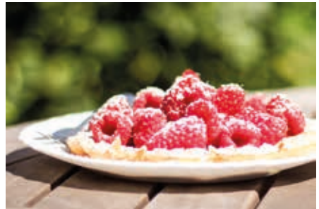
Vom Strauch auf den Teller: So frisch gibt es die Himbeeren nur in Steinwehr.

gemeißelter Inschrift. Schon die Fahrt zum Gut durch die schöne Landschaft ist ein Erlebnis, durch malerische Dörfer und vorbei an reetgedeckten Häusern, Bauernhöfen und Pferdekoppeln. Im Hofladen werden verschiedene selbstgemachte Pro-