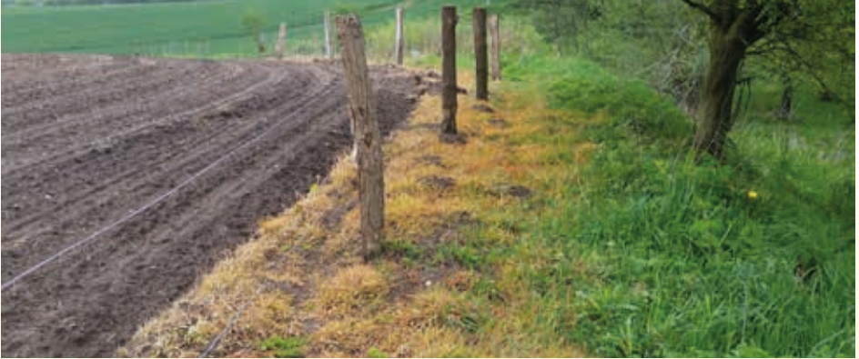
Schiere Äcker dank Glyphosat: Der konventionelle Landbau verlässt sich ganz auf chemische Herbizide.