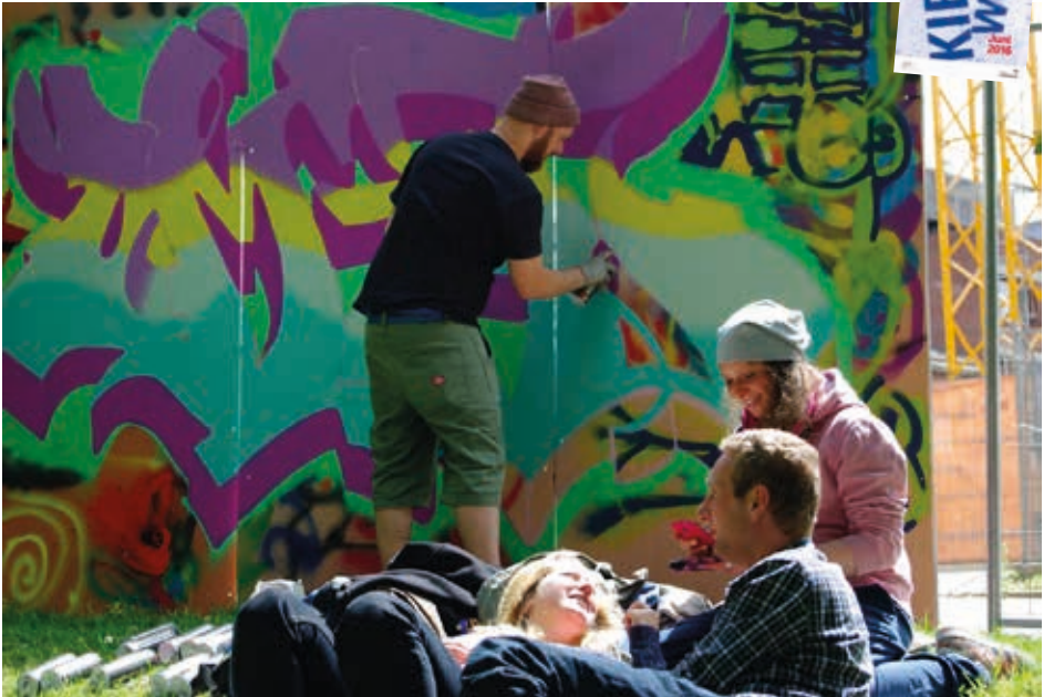
Mitmach-Programm für Jugendliche: Der Playground zur Kieler Woche.