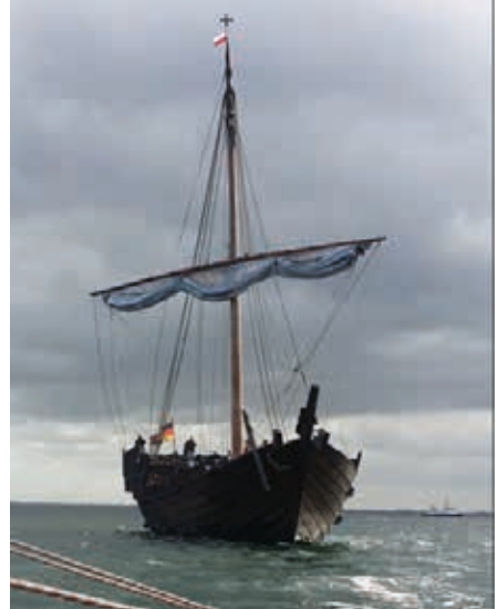
Blickfang auf der Förde: Die Kieler Kogge.

Tagesausflüge, Charterfahrten und Stegveranstaltungen helfen, die laufenden Kosten zu decken. Eine gute Gelegenheit, Seeluft zu schnuppern, bieten zwei Kieler-Woche-Törns am Montag, 20. Juni, für die