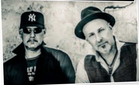
Das Sommer-Highlight am Großen Plöner See: Fools Garden & Wingenfelder

die ehemaligen Köpfen von „Fury in the Slaughterhouse“. „Fools Garden“ landete 1996 mit „Lemon Tree“ einen Megahit, der rund um die Welt ging. Ihre Tourneen führen sie seitdem quer über den Erdball.