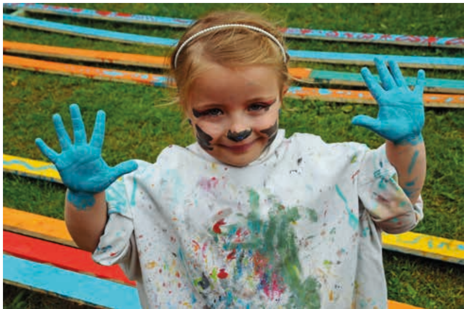
Kleckschen und Malen erlaubt: Auf der Krusenkoppel dürfen die Kinder kreativ werden.