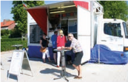
Von Rotbarsch bis Stremel-Lachs: Die Mobile Fischräucherei am Hafen von Laboe.