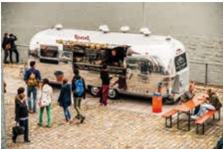
Food Trucks am Bootshafen.

in die dampfenden Garküchen Afrikas, Südasiens und Lateinamerikas. Und noch ein Anliegen hat die Veranstaltung: Weil Liebe ja bekanntlich durch den Magen geht, soll auf diese Weise eine Verständigung zwischen den Kulturen, ja praktische Integration erreicht werden – so zumindest das Ziel der veranstaltenden Vereine „people welcome“ und „Street Food Events“. Begriffe, wie Bio, Fairtrade, regionale Produkte und artgerechte Tierhaltung sollen dabei laut Ankündigung ebenfalls groß geschrieben werden. Der Eintritt ist frei. Der Event geht am Sonntag von 11 bis 20 und am Sonntag von 11 bis 18 Uhr. Weitere Infos unter www.street-food-events.com . Die Street-Food-Karawane führt übrigens durch 16 deutsche Städte.