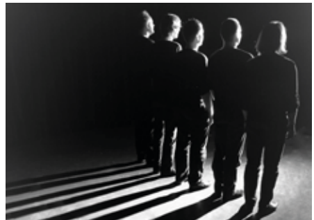
Die studentische Theatergruppe Spiegelbilder spielt im Sechseckbau.

Die Theatergruppe Spiegelbilder präsentiert „Draußen vor der Tür“ von Wolfgang